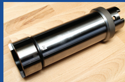
Nastavný trn s kuželem HSK

K seřizovacím přístrojům je nabízena široká paleta příslušenství, jako jsou například různé adaptéry, nastavné trny, tiskárny, připojení k sítím či TDM systémům. Pokud v této nabídce zákazník nenajde potřebné příslušenství pro svoji aplikaci, je firma Grumant schopna zajistit návrh a výrobu formou speciální zakázky.