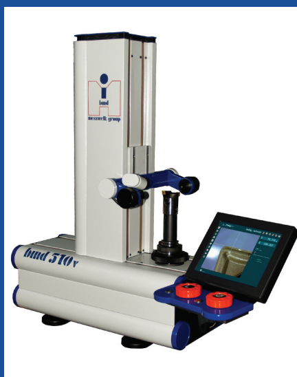
Seřizovací přístroj řady 500v

Tato modulární řada přístrojů se vyrábí podle konkrétního zadání uživatelů, kteří na trhu hledají přístroj s nejvyšší přesností a možností